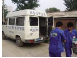
▲(唐山)格力专卖店都配备统一形象的工程车

北京和唐山的上述两位随机采访对象都对格力的安装服务表示满意,记者也发现格力在安装和售后服务上的几点做法值得同行学习和用户注意:一是其安装流程都严格按照珠海总部统一下发的操作手册执行,总部还会定期跟踪拍摄每个安装工的安装实况,开会时播放比较,不规范的要进行警告或罚款,所以记者没有发现北京和唐山的两支安装队的工作有什么不同;二是强调服务细节,比如室外机的挂架,很多厂家都只打4个孔,而格力则要求必须打6个深10cm的孔,管线的转角也必须成直角,既外型美观,又充分利用了原配材料,杜绝出现故意迂回、向用户多算材料费的“秤砣钩”(U型转角)。