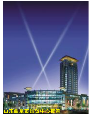
山东曲阜市国贸中心夜景

此次中标的格力中央空调包括大型离心式机组、水冷螺杆机、模块化风冷热水机组、模块化数码多联机及大批末端设备。按照工程进度安排，装上格力中央空调的曲阜国贸中心预计在今年内竣工投入使用，届时，中外游客在凭吊先哲风范的同时，也将可以到该中心亲身体验格力中央空调所营造的舒适宜人的购物休闲环境。