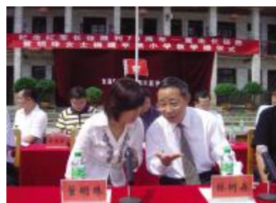
▲ 董明珠总裁与贵州省委副书记、代省长林树森在仪式现场

本报讯 “董明珠女士捐建平浪小学教学楼仪式”于8月9日在贵州省黔南州都匀市平浪镇小学举行。董明珠总裁将其所得的30万元稿费，捐赠给该校用于建设教学楼。