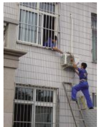
▲(北京)与同楼的其他品牌空调相比,格力室外机挂架要多打两个

空调而被格力河北分公司罚款5万元。目前,格力旗下的经销商在执行格力总部的任务时较能步调一致,不再是以前那种松散的合作关系了。