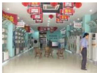
▲格力河北分公司与天汇在唐山开设的第一家专卖店

7月5日晚,中央电视台经济频道《中国财经报道》栏目播出的《大卖场,我不是真的离不开你?》的专题节目引起业界关注,它报道的是格力空调因不满合作政策,在2004年3月从国美卖场退出之后,其专卖店模式的发展状况。难道格力真如央视记者所言,其销售势头在深圳、武汉等南方市场“不降反升”?