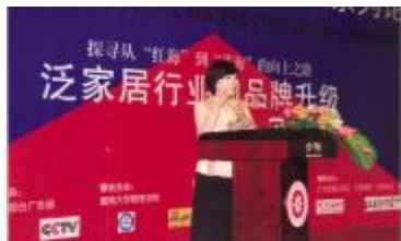
▲董明珠总裁在论坛上发表演讲

由中央电视台、南方都市报、21世纪经济报道和益策(中国)学习管理机构联合推出的“广东企业，领跑中国”系列论坛，云集了粤商优秀范本、国内资深品牌专家，深层解剖品牌精髓，以国内最具影响力的电视