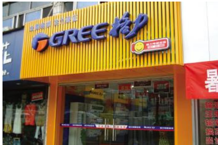
▲具有统一“黄色门面”、醒目蓝红格力标识装扮的格力电器连锁专卖店

本报讯 7月15日，格力在湖南一次推出10家连锁专卖店，表明家电行业渠道在变革。